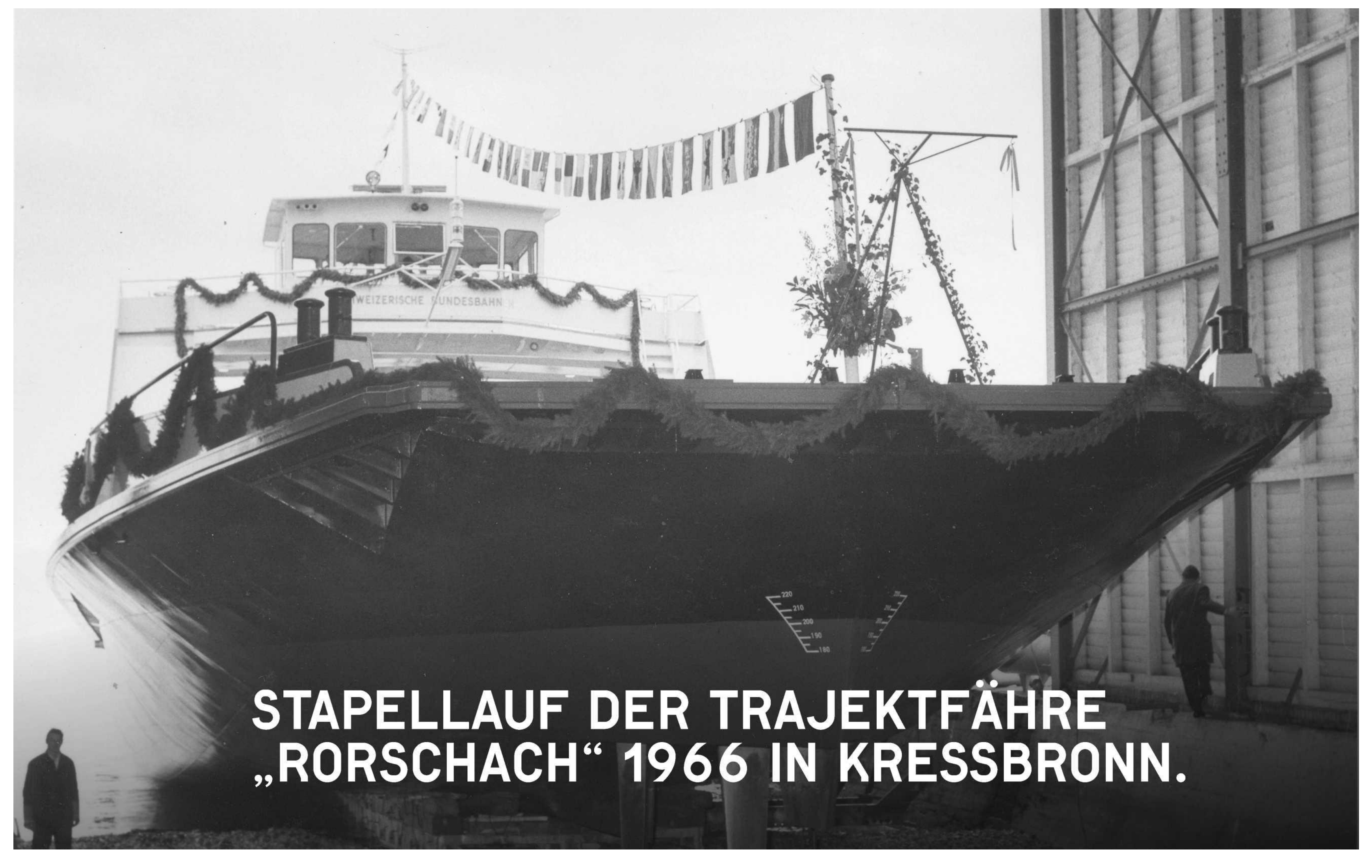
STAPELLAUF DER TRAJEKTFAHRE „RORSCHACH“ 1966 IN KRESSBRONN.