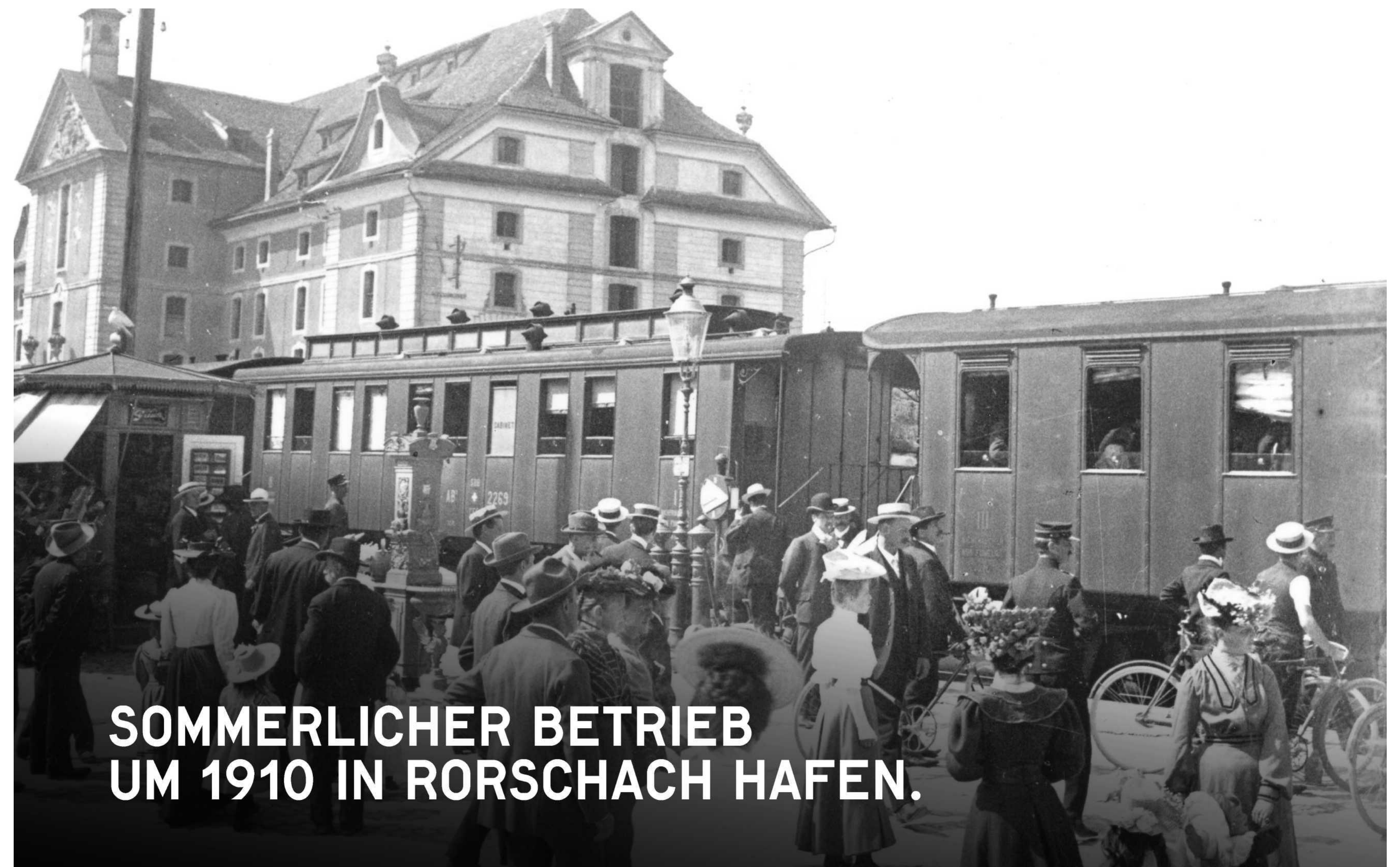
SOMMERLICHER BETRIEB UM 1910 IN RORSCHACH HAFEN.