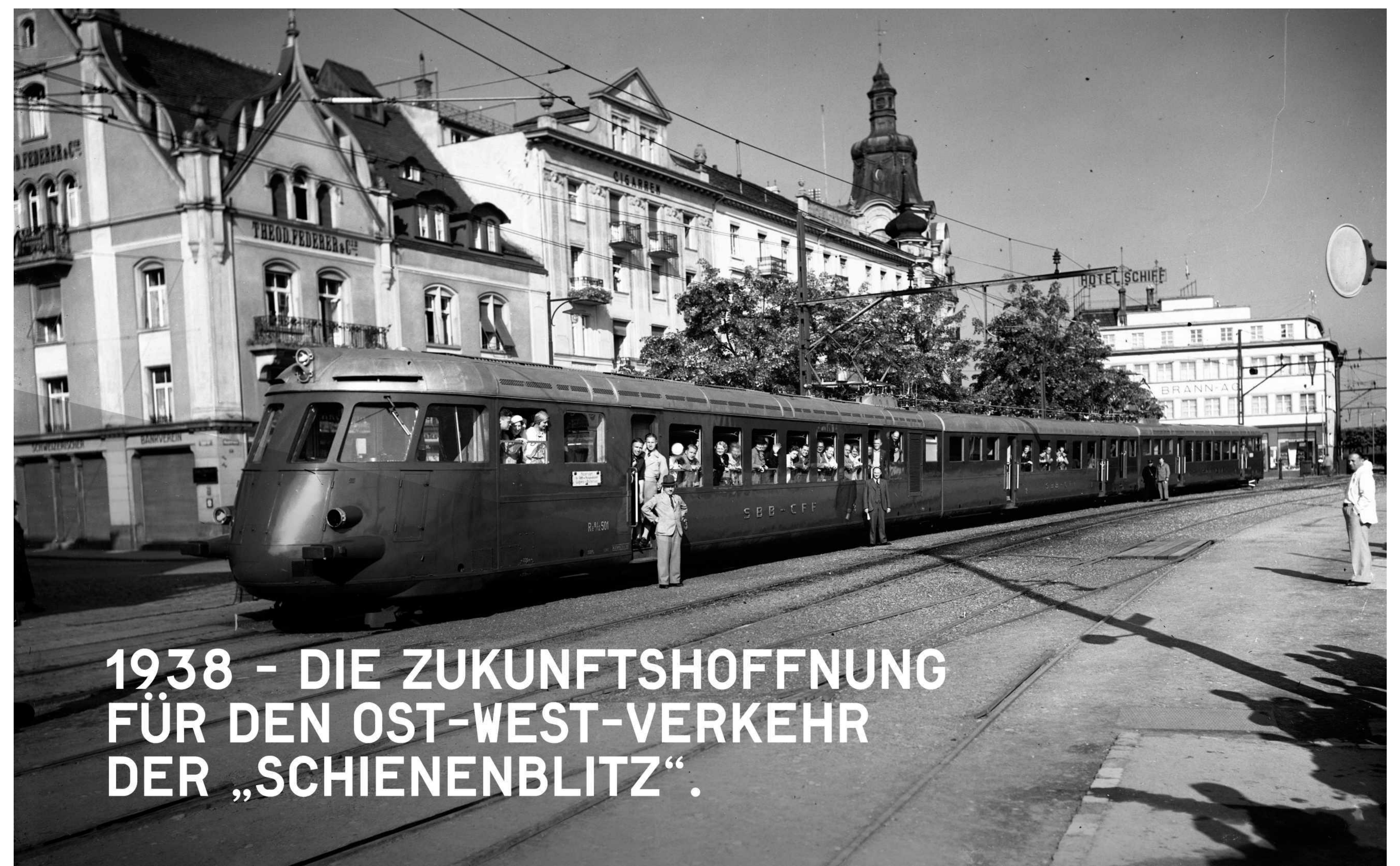
1938 - DIE ZUKUNFTSHOFFNUNG FÜR DEN OST-WEST-VERKEHR DER „SCHIENENBLITZ“.