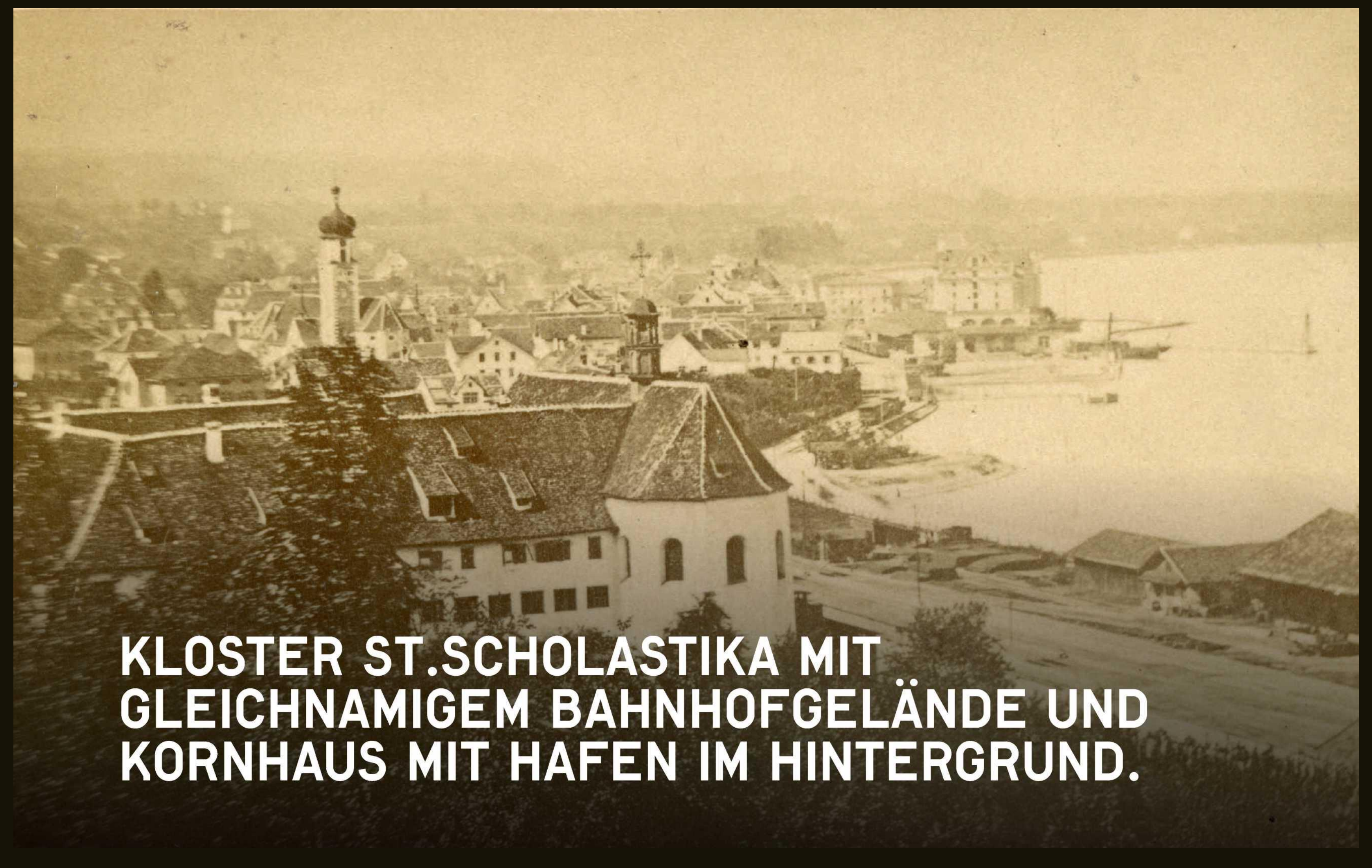
KLOSTER ST.SCHOLASTIKA MIT GLEICHNAMIGEM BAHNHOFGELÄNDE UND KORNHAUS MIT HAFEN IM HINTERGRUND.